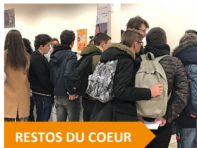
RESTOS DU COEUR