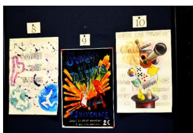
A droite : affiche gagnante