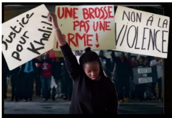
Ci-dessus : photo primée « The Hate U give », réalisation 3A.

Le Défi Babelio est une action engagée dans plusieurs établissements de France et d'ailleurs. Elle réunit des élèves de collège et de lycée autour d'une bibliothèque virtuelle constituée de 30 à 40 livres de littérature jeunesse.