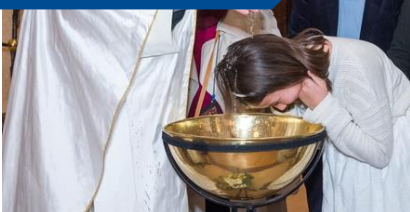
ND St Louis de la Guillotière