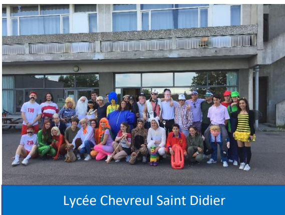
Lycée Chevreul Saint Didier

Pour leur dernier jour dans les murs de leur lycée, les élèves de Terminale se déguisent et passent de derniers bons moments tous ensemble avant leur Bac. Un bal de promo a également été organisé le mardi 25 juin.