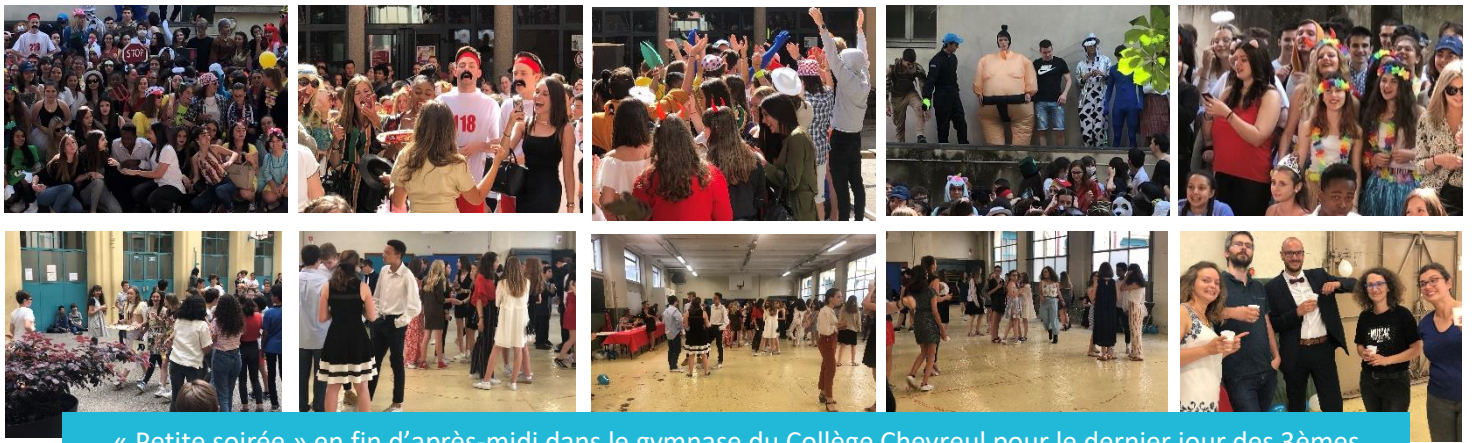
« Petite soirée » en fin d'après-midi dans le gymnase du Collège Chevreul pour le dernier jour des 3èmes