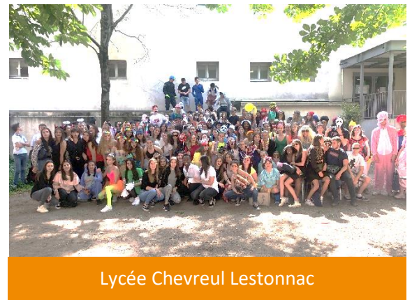
Lycée Chevreul Lestonnac